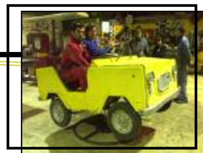
structure Alama's en construction