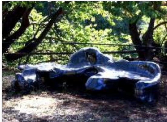
mobilier urbain : le banc organique.

Sud Side intervient dans la coordination, l'encadrement technique et artistique de douze salariés d'un chantier d'insertion mis en place par l'ApCAR autour de l'aménagement paysager, de la construction de mobilier (le banc organique) et d'écritures collectives (le carnet de rives retraçant la vie du chantier, "les trésors de la cascade", récit mythologique collectif, "les anges gardiens", portraits photographiques, "le plan puzzle" dessin typographique), autour de la cascade des Ayyalades.