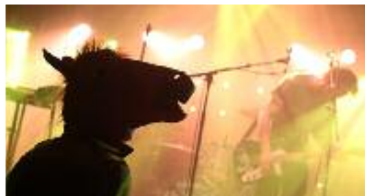
douze heures de fête,