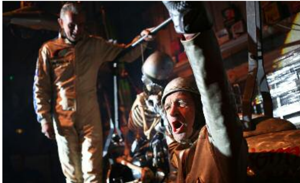
un compteur qui explose à deux mille personnes,

"Bienvenue dans le gâteau d'anniversaire à tous les raisins secs et les petites cerises. Trente ans un frisson pour l'humanité, une vie pour Sud Side..." extrait du discours du Président.