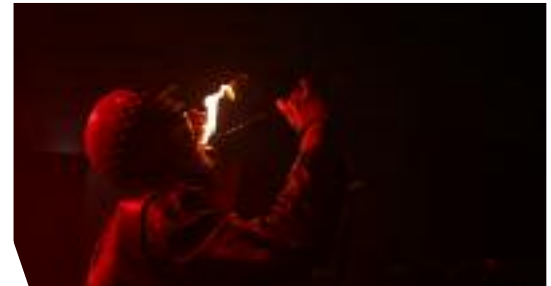
mélange des gens et des arts.