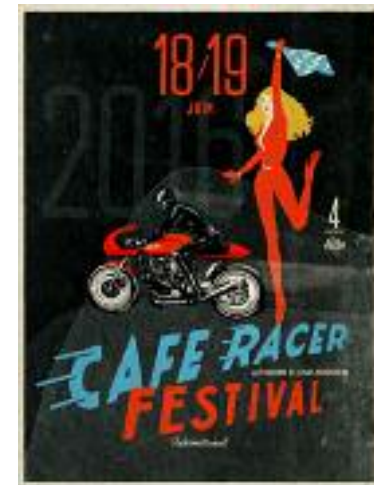
affiche de l'événement