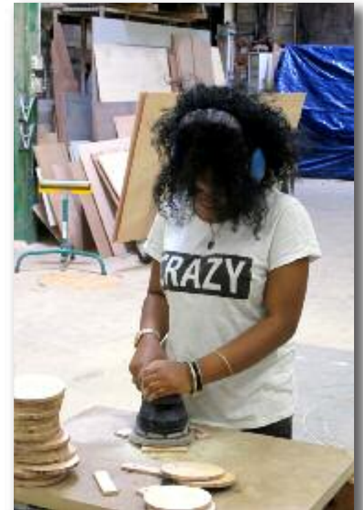
Fabrication de Jeux en bois géants

Ces plateformes ressources s'accompagnent d'un partenariat avec l'ApCAR autour de la visite et de la rencontre des Habitants de la Cité des arts de la rue.