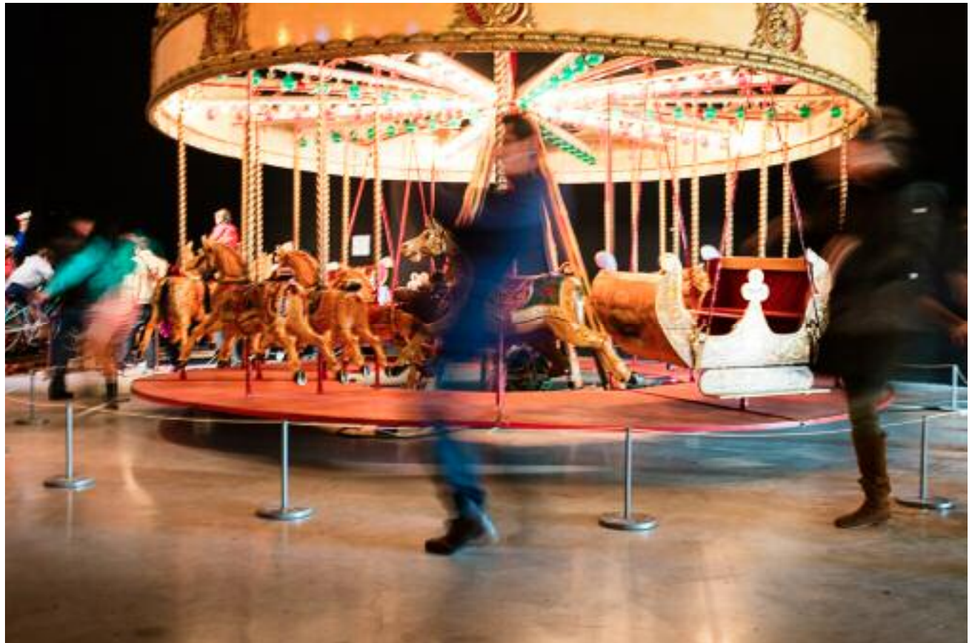
Le manège Burton remonté par les ateliers Sud Side dans la grande Halle de la Cité des arts de la rue.

Le manège remonté a été présenté aux publics lors des "Echappées Foraines", événement organisé par Karwan, à la Cité des arts de la rue, en décembre.