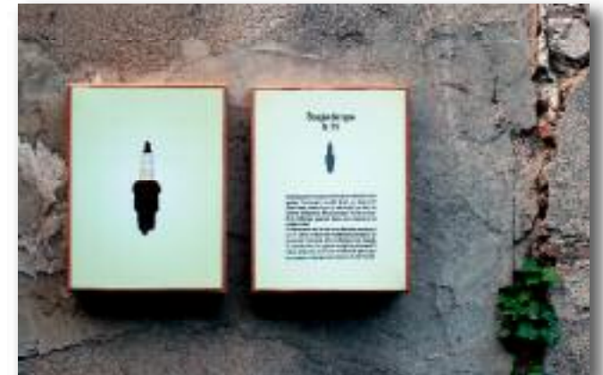
"Les trésors de la cascade"- exposition permanente in situ