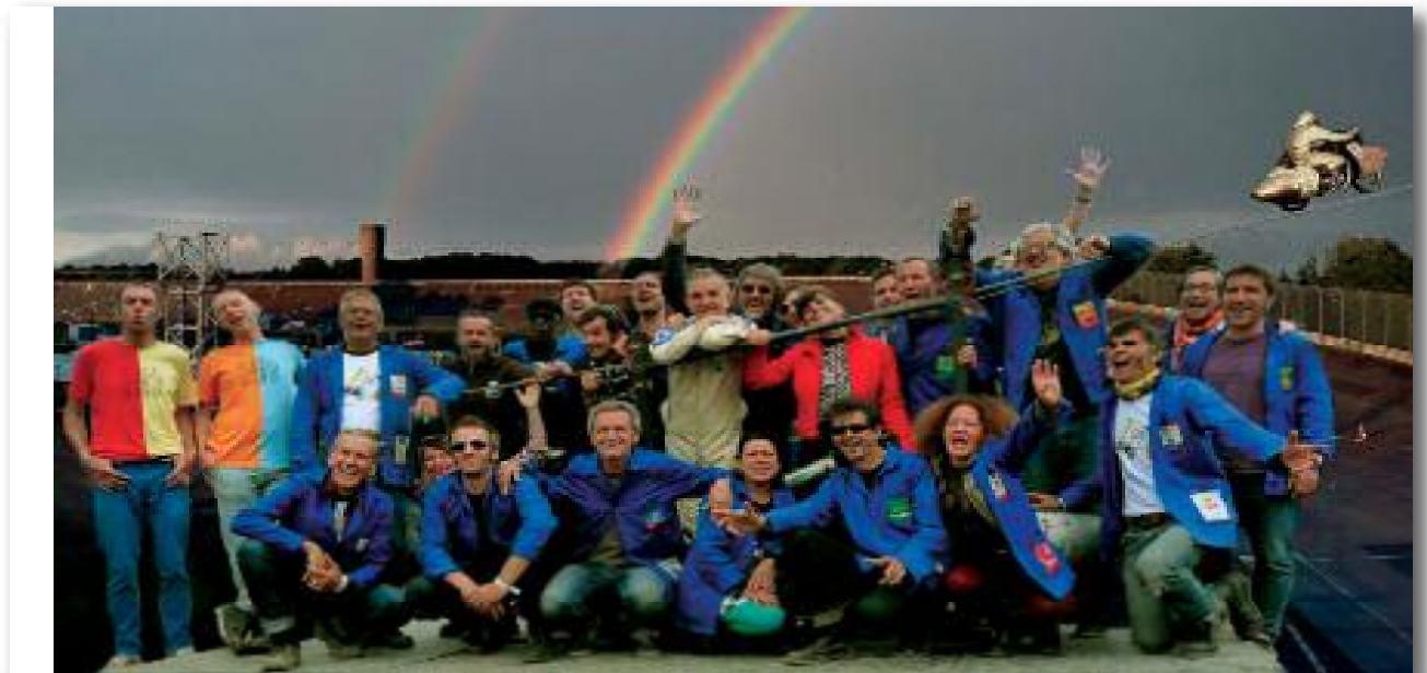
Sud Side à Montlhéry (membres du garage, salariés de l'association, sérigraphes résidents...).

Un nouveau poste d'Assistante aux archives iconographiques et développeuse d'outils de communication a été mis en place.